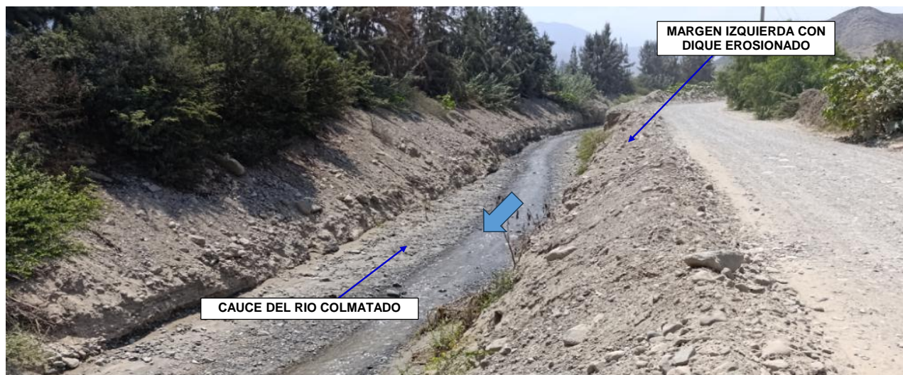
FIGURA N°01: QDA PISQUILLO ORCÓN, SECTOR PISQUILLO CUYOS DIQUES EN AMBOS LADOS DEL CAUCE SE ENCUENTRA EN ESTADO DE EROSION Y EN OTROS TRAMOS NO HAY DIQUE.