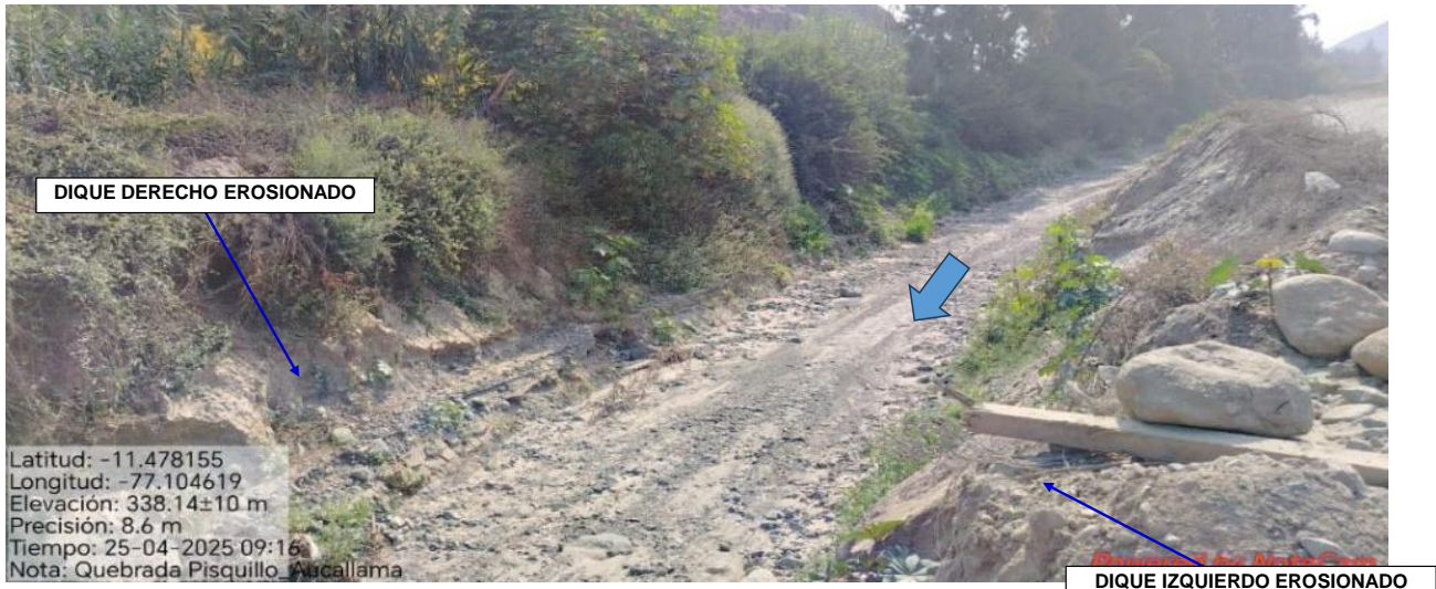
FIGURA N°04: QDA PISQUILLO ORCÓN, SECTOR PISQUILLO CON LOS DIQUES DE AMBOS LADOS EN ESTADO DE EROSION, CAUSE COLMATADO DE FLUJO DE DETRITOS Y TROCHA CARROZABLE CON RIESGO A EROSION.