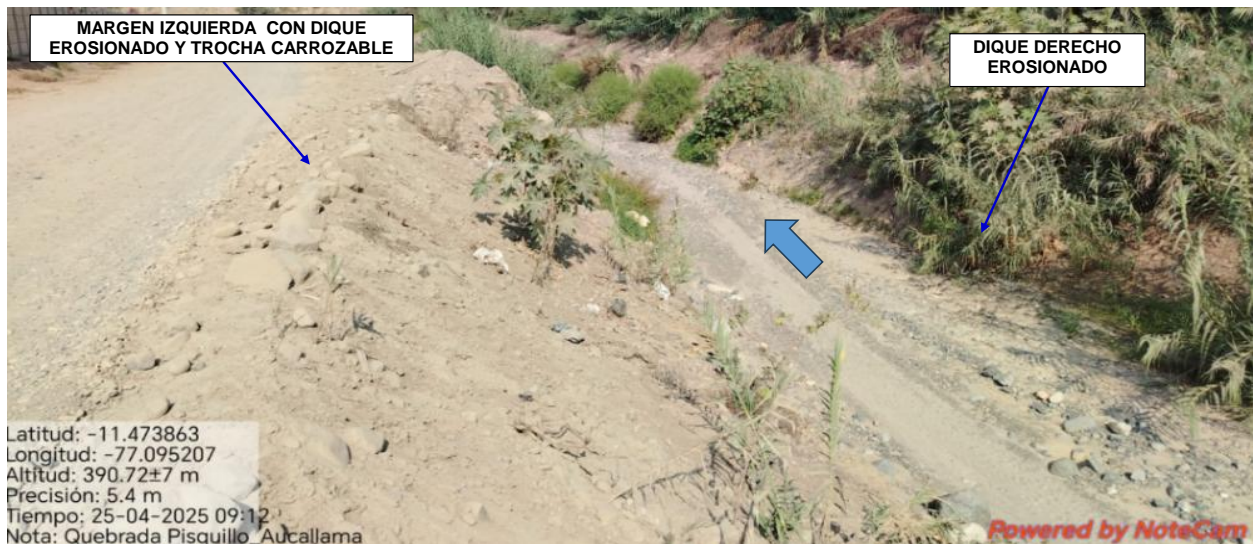
FIGURA N°03: SECTOR PISQUILLO CON LOS DIQUES DE AMBOS LADOS EN ESTADO DE EROSION, CAUSE COLMATADO DE FLUJO DE DETRITOS Y LA TROCHA CARROZABLE PALPA - ORCON - PACAYBAMBA.