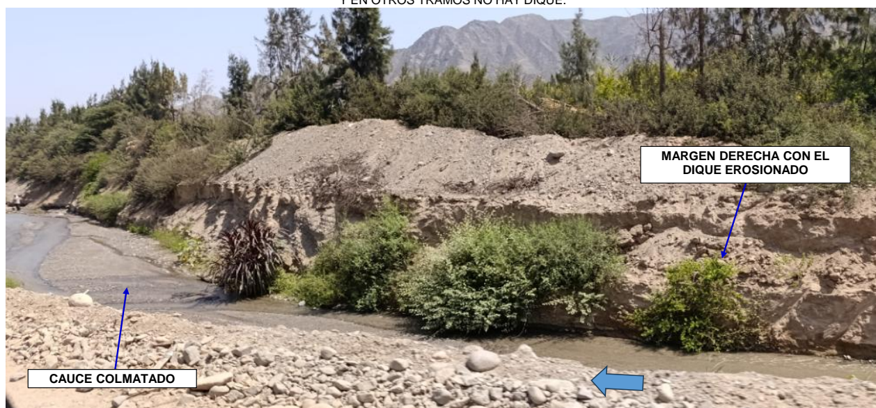
FIGURA N°02: TRAMO CRÍTICO EN LA QDA PISQUILLO ORCON, SECTOR PISQUILLO CON DIQUES EROSIONADOS EN AMBOS LADOS DEL CAUCE, A SU VEZ EL CAUCE SE ENCUENTRA COLMATADO DE SEDIMENTO.